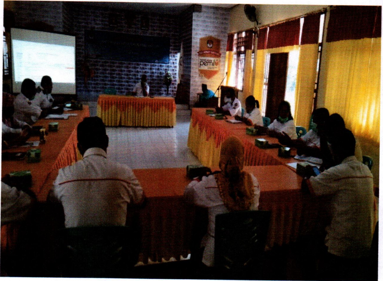
FOTO RAPAT PLENO RUTIN KPU KABUPATEN SIKKA