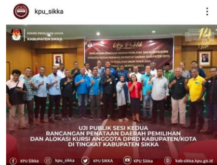
Liked by jmmhayon and 10 others kpu_sikka #TemanPemilih, KPU Kabupaten Sikka menggelar Uji Publik Gelombang Kedua, terhadap Rancangan Daerah Pemilihan dan Alokasi Kursi Anggota DPRD Kabupaten/Kota di tingkat Kabupaten Sikka, dalam Pemilu Tahun 2024, Sabtu (10/12/2022).

#KPUmelavani #KPUsikka #PemiluSerentak2024