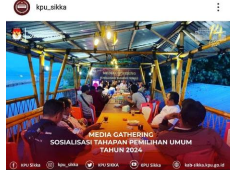
10 likes kpu_sikka #TemanPemilih, Sesuai ketentuan pasal 28 ayat (1) Peraturan KPU Nomor 9 tahun 2022 bahwa salah satu sasaran peningkatan partisipasi masyarakat adalah Media Massa. Berangkat dari hal itu pada Kamis (24/11/2022) petang, KPU Sikka melakukan kegiatan "Media Gathering" Sosialisasi Tahapan Pemilu yang melibatkan Pers/Wartawan/Media Massa di lingkup Kabupaten Sikka.

Lebih lanjut tentang KPU Sikka: Facebook: KPU Sikka Instagram: KPU_Sikka Twitter: KPU_Sikka Youtube: KPU Sikka Web: kab-sikka.kpu.go.id PPID: sikkakabppid.kpu.go.id