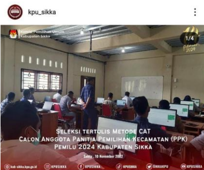
18 likes kpu_sikka #TemanPemilih KPU Kabupaten Sikka kembali melaksanakan Seleksi Tertulis untuk Perekrutan Panitia Pemilihan Kecamatan (PPK) untuk hari ke dua, Sabtu (10/12).

Tes yang berbasis komputer dengan metode CAT ini berlangsung di SMK Negeri 1 Maumere. Seleksi tertulis ini di bagi dalam 4 (empat) sesi dengan durasi waktu per sesinya 90 menit dengan jumlah 75 soal.