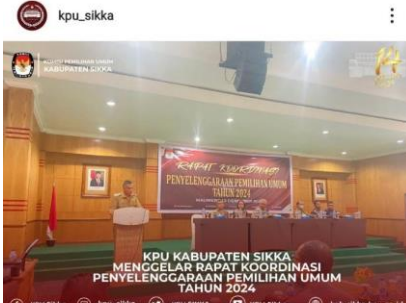
Liked by jmmhayon and 17 others kpu_sikka #TemanPemilih KPU Sikka menggelar Rapat Koordinasi (Rakoor) Penyelenggaraan Pemilihan Umum Tahun 2024, Selasa (13/12/2022).

Harapan besar bagi KPU Sikka kepada Pemilih Pemula agar turut berpartisipasi aktif dan cerdas dalam Pemilu 14 Februari 2024 mendatang.